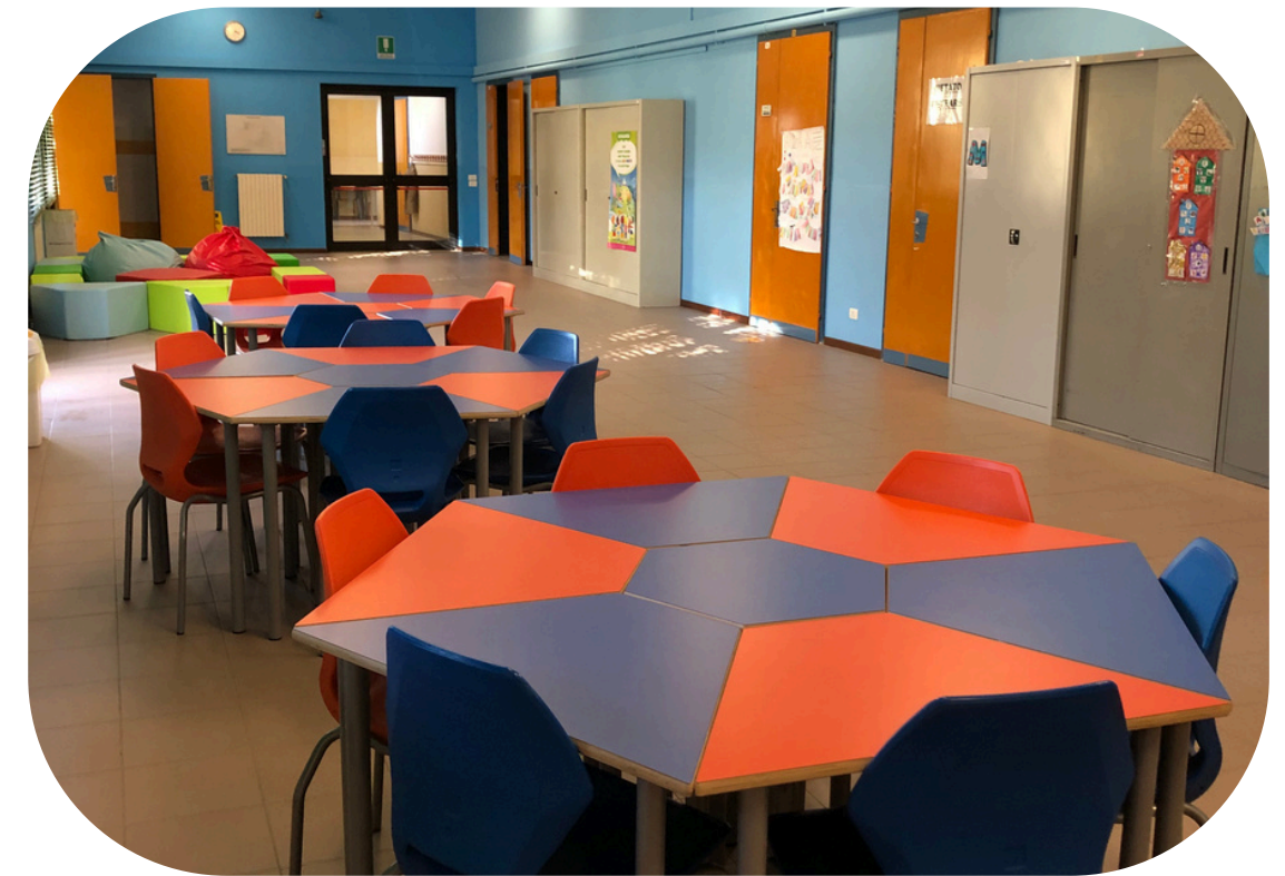
Spazio per il lavoro collaborativo