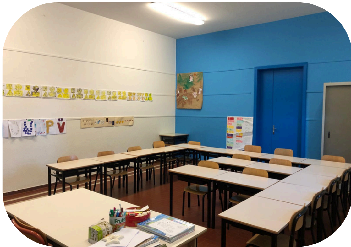
Aula a righe

Flessibili, dinamici e adattabili per la lettura, l'impegno, il confronto, la scoperta ed il rilassamento. Qui devono trovare posto non solo le attività didattiche ma anche i diversi stili cognitivi e relazionali dei bambini.