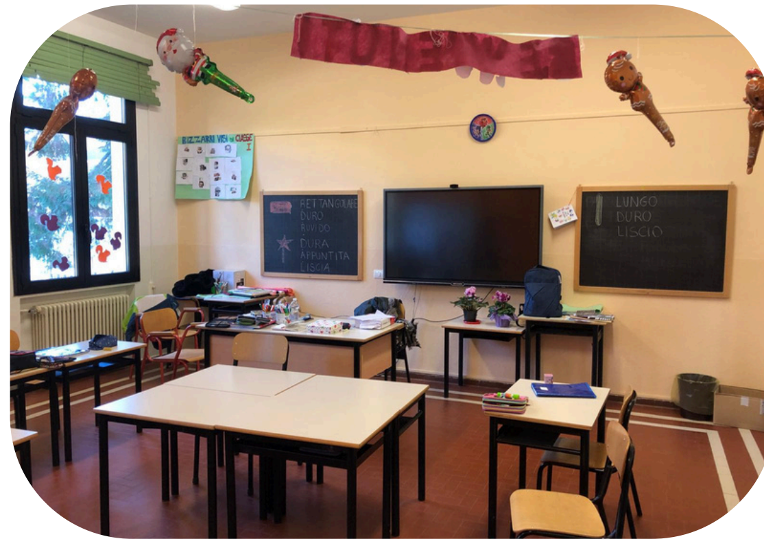
Aula a quadretti